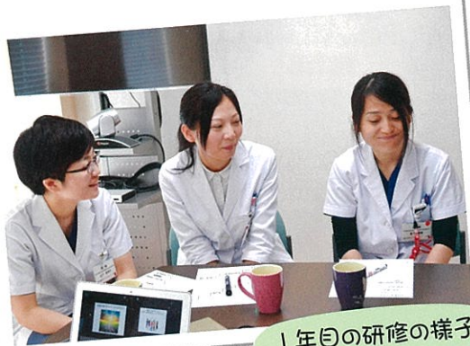
1年目の研修の様子