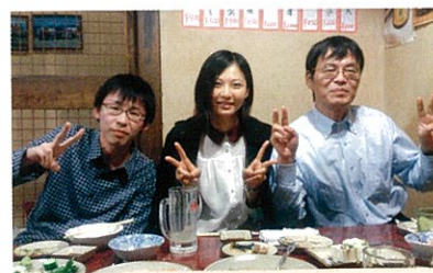
指導医の先生方にはあたたかいご指導をいただいています